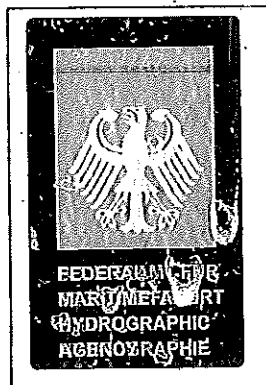
(Seal or stamp of issuing authority, as appropriate) (Siegel bzw. Stempel der ausstellenden Behörde)

(Unterschrift des ordnungsgemäß ermächtigten Bediensteten, der das Zeugnis ausstellt)