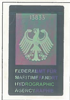
(Seal or stamp of issuing authority, as appropriate) (Siegel bzw. Stempel der ausstellenden Behörde)