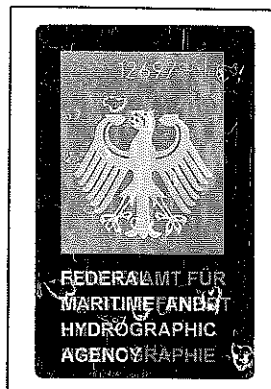
(Seal or stamp of issuing authority, as appropriate) (Siegel bzw. Stempel der ausstellenden Behörde)

(Signature of the duly authorized official issuing the certificate) (Unterschrift des ordnungsgemäß ermächtigten Bediensteten, der das Zeugnis ausstellt)