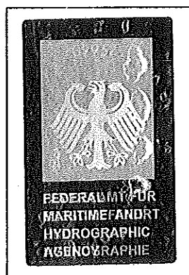
(Seal or stamp of issuing authority, as appropriate) (Siegel bzw. Stempel der ausstellenden Behörde)

(Signature of the duly authorized official issuing the certificate) (Unterschrift des ordnungsgemäß ermächtigten Bediensteten, der das Zeugnis ausstellt)