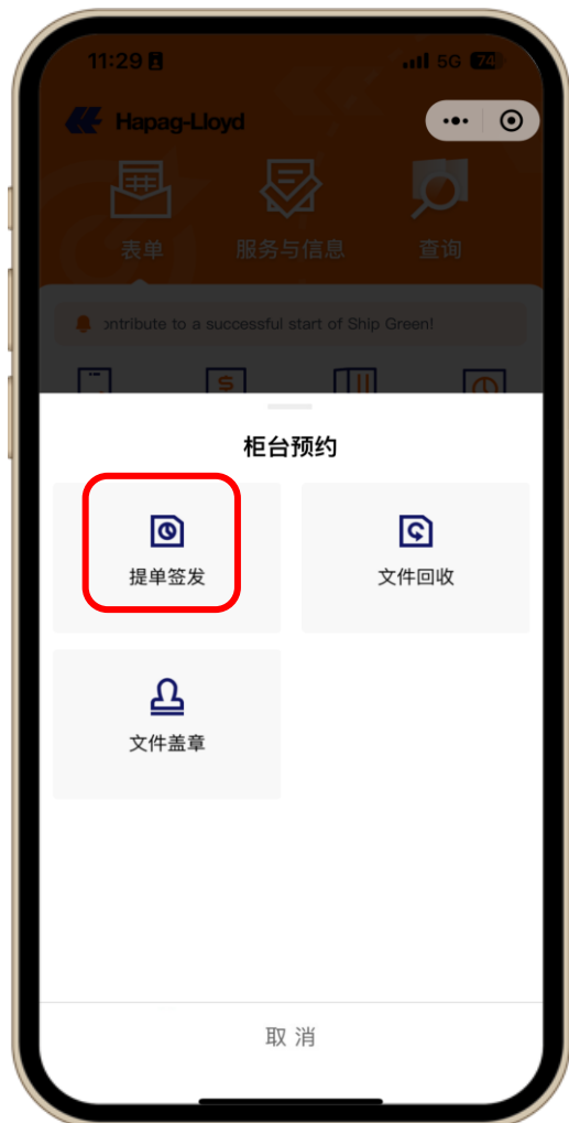
3. 选择预约的时间地点