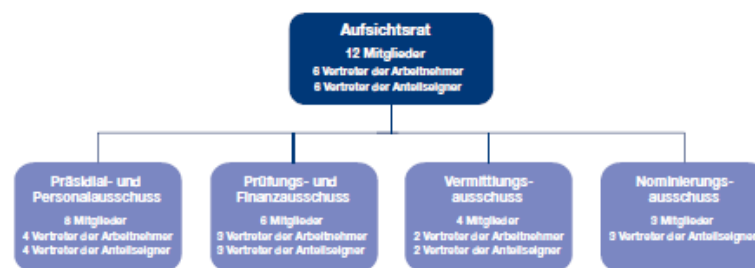
Aufsichtsrat und Ausschüsse der Hapag-Lloyd AG

Der Aufsichtsrat hat zur effizienten Wahrnehmung seiner Aufgaben insgesamt vier Ausschüsse eingerichtet, die die Beschlüsse des Aufsichtsrats sowie die im Plenum zu behandelnden Themen vorbereiten. Soweit dies gesetzlich zulässig ist, werden in Einzelfällen Entscheidungsbefugnisse des Aufsichtsrats auf seine Ausschüsse übertragen. Der Aufsichtsrat hat einen Präsidial- und Personalausschuss, einen Prüfungs- und Finanzausschuss, einen Vermittlungsausschuss und den Nominierungsausschuss gemäß § 27 Abs. 3 Mitbestimmungsgesetz als ständige Ausschüsse eingerichtet.